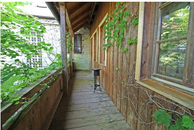
Zugang zum Haus