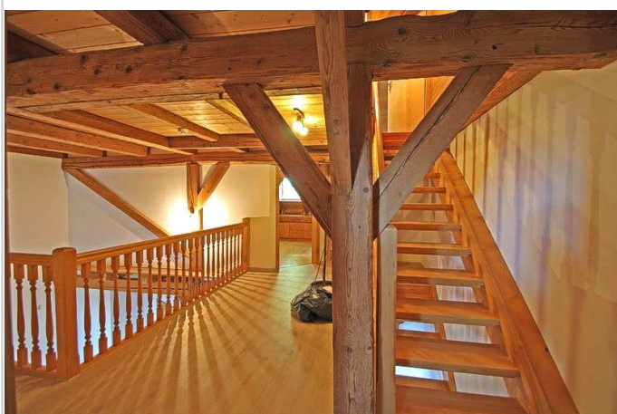
Treppe zum Dachgeschoss