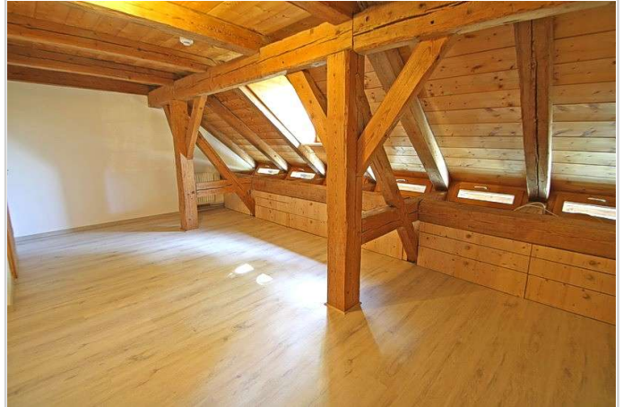
1. Schlafzimmer mittlere Ebene