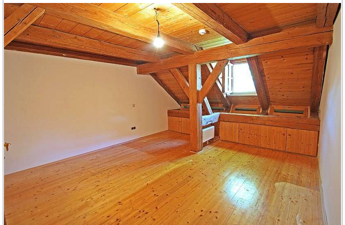
2. Schlafzimmer mittlere Ebene