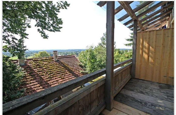
Ruhiger West Balkon