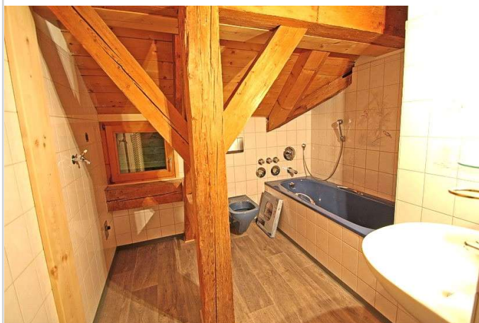
Bad mit Wanne u Dusche