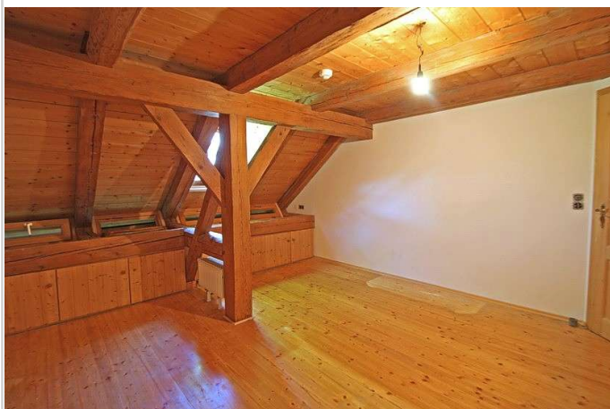
1. Schlafzimmer mittlere Ebene

Zimmer: 4,00 Wohnfläche ca.: 183,00 m 2 Kaltmiete: 1.290,00 EUR (zzgl. Nebenkosten) Gesamtmiete: 1.570,00 EUR