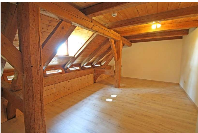
1. Schlafzimmer mittlere Ebene