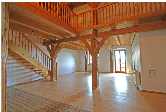
Wohnzimmer m. Galerie u Balkon