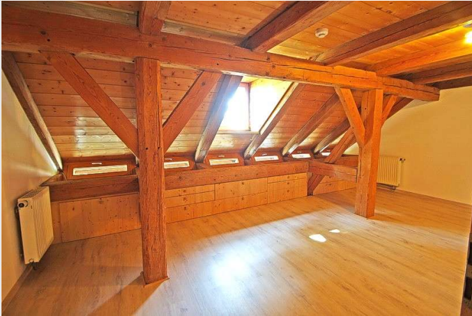
1. Schlafzimmer mittlere Ebene

Zimmer: 4,00 Wohnfläche ca.: 183,00 m 2 Kaltmiete: 1.290,00 EUR (zzgl. Nebenkosten) Gesamtmiete: 1.570,00 EUR