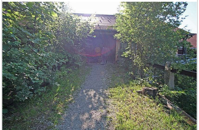
Aufgang zum Haus