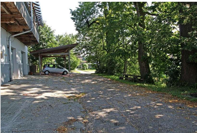
Blick zum Balkon