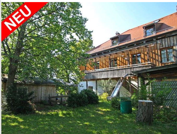
Denkmalgeschützt mit Garten

Zimmer: 4,00 Wohnfläche ca.: 183,00 m 2 Kaltmiete: 1.290,00 EUR (zzgl. Nebenkosten) Gesamtmiete: 1.570,00 EUR