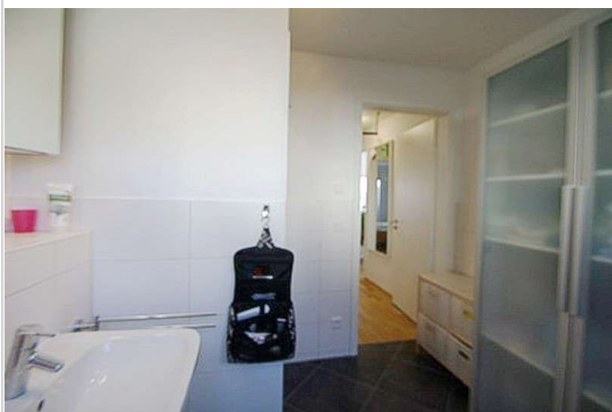
Badezimmer weitere Ansicht

Zimmer: 2,00 Wohnfläche ca.: 65,00 m 2 Kaltmiete: 975,00 EUR (zzgl. Nebenkosten) Gesamtmiete: 1.270,00 EUR