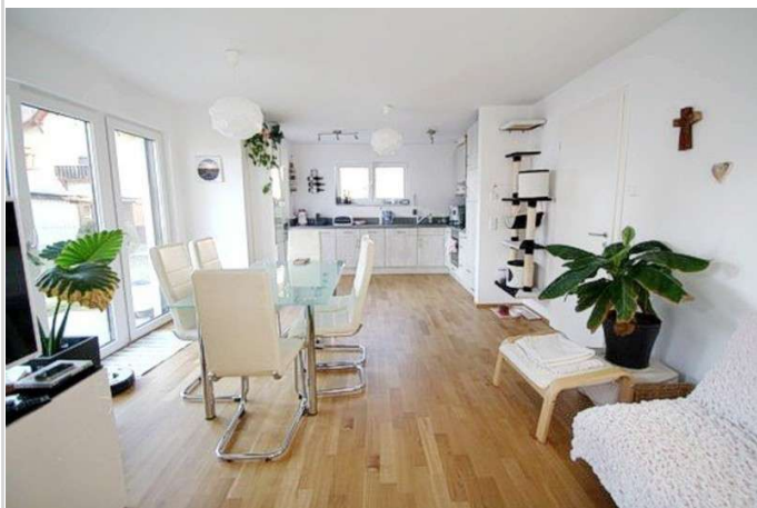
Wohnzimmer m. offener Küche

Zimmer: 2,00 Wohnfläche ca.: 65,00 m 2 Kaltmiete: 975,00 EUR (zzgl. Nebenkosten) Gesamtmiete: 1.270,00 EUR