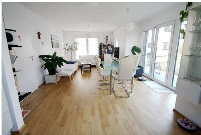
Wohnzimmer weitere Ansicht