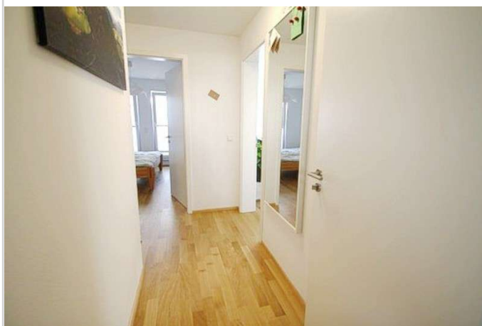
Weitere Ansicht Diele