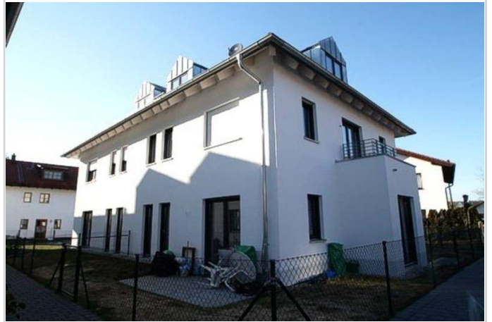
Kleine Moderne Wohnanlage