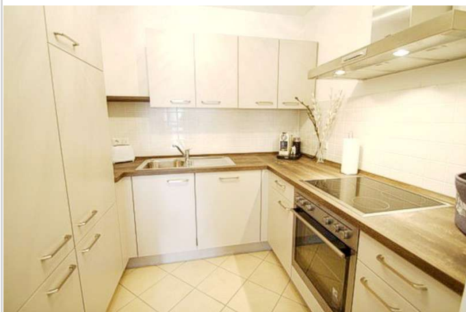
Küche mit Einbauküche