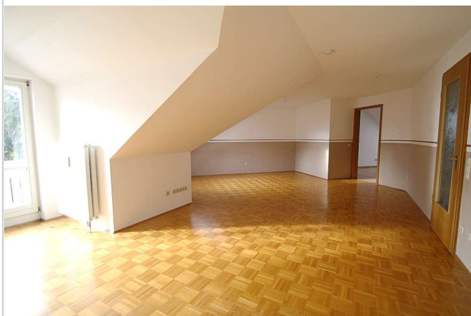
Wohnzimmer weitere Ansicht