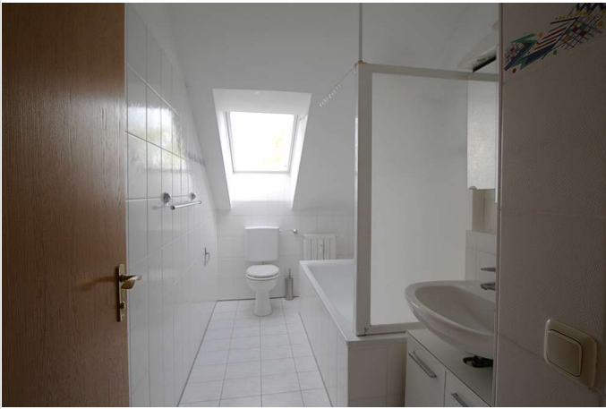
Badezimmer mit Fenster

Zimmer: 3,00 Wohnfläche ca.: 86,00 m 2 Kaltmiete: 1.120,00 EUR (zzgl. Nebenkosten) Gesamtmiete: 1.500,00 EUR