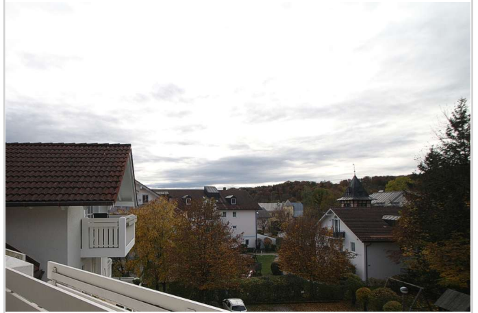
Über den Dächern der Stadt