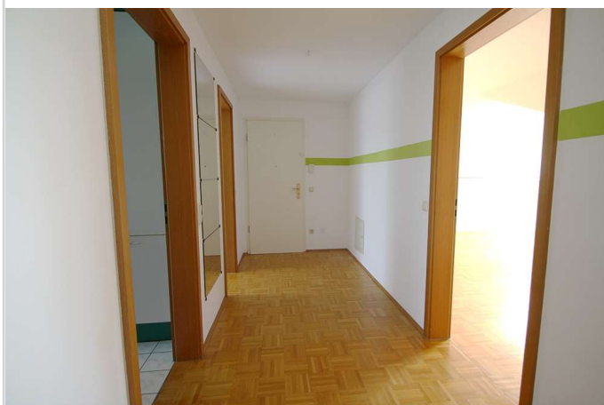
Diele weitere Ansicht