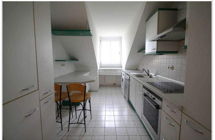
Küche mit Einbauküche