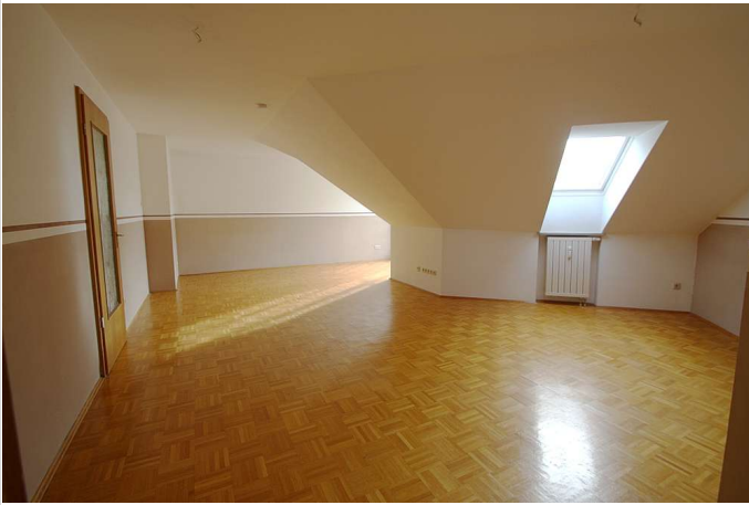
Wohnzimmer weitere Ansicht

Zimmer: 3,00 Wohnfläche ca.: 86,00 m 2 Kaltmiete: 1.120,00 EUR (zzgl. Nebenkosten) Gesamtmiete: 1.500,00 EUR